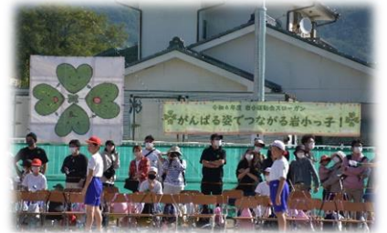
校庭に掲げられたスローガン