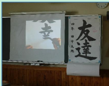
動画も参考に書写に取り組みます