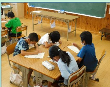
友だちとの勉強 楽しいね！