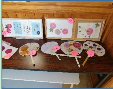
夏休みに作った作品が廊下に 並びます