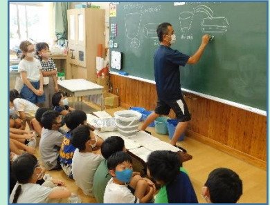
算数「かさ」の学習 2学期も勉強がんばるよ！