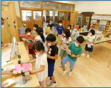
夏休みに読んだ本を返します たくさん読めたかな