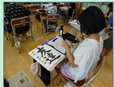
背筋をピンと伸ばして書きます