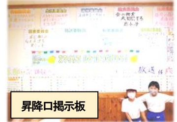
廊下に掲示されたスローガン

「心に太陽を」第6号では、『岩小スマイル運動会』までのプロセスや、学校からの連絡などについてお知らせしたいと思います。