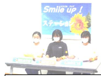
全校放送でスローガンを発表

回答をもとに、早速児童会本部役員さんは、テレビ放送を使って全校児童に今年の運動会への思いを発信しました。最後に、「全校のみなさんで、スマイルでひとつにつながるような岩小スマイル運動会をつくりあげましょう!」という力強いメッセージが伝えられました。本番が楽しみです♪