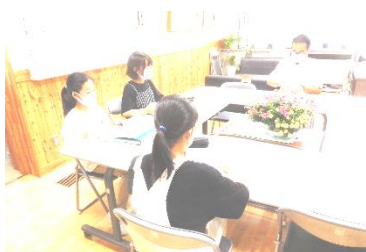
提案について校長先生と懇談

回答をもとに、早速児童会本部役員さんは、テレビ放送を使って全校児童に今年の運動会への思いを発信しました。最後に、「全校のみなさんで、スマイルでひとつにつながるような岩小スマイル運動会をつくりあげましょう!」という力強いメッセージが伝えられました。本番が楽しみです♪